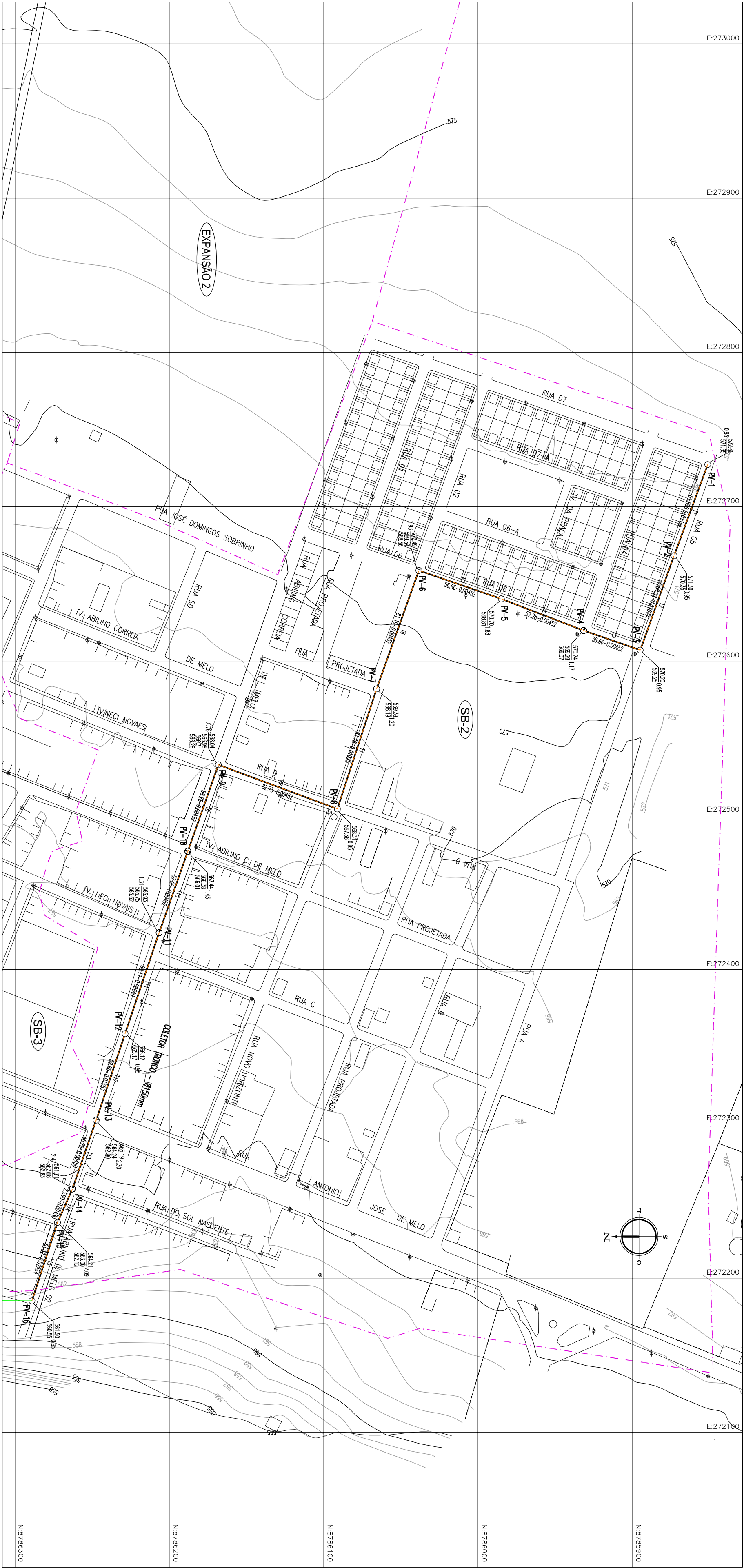
PLANTA ESCALA 1/2000